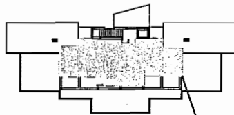
VIVIENDA 1.2A1 (PA-BLOQUE2)